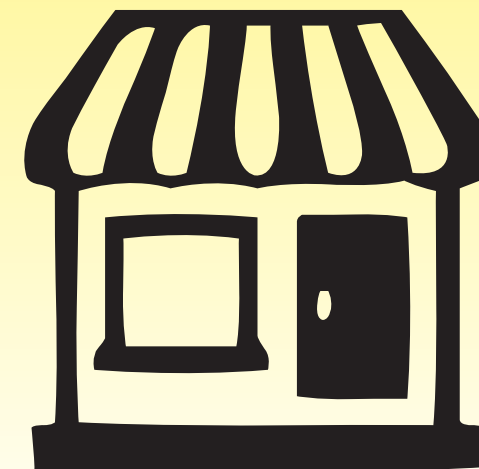
Bijouteries, Buralistes, Boulangeries, etc.

Avec de la prudence, un comportement adéquat et des mesures adaptées, le risque d'être victime d'un cambriolage peut être réduit de manière significative.